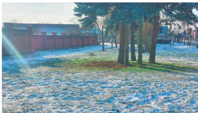
Teren pozyskany od KOWR