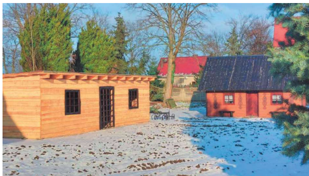
Teren rekreacyjny, Park 700-lecia Długiego Starego