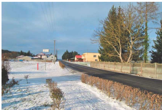
Główna droga przez wieś