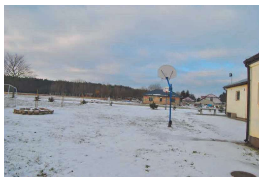
Teren za świetlicą, miejsce na wiatę