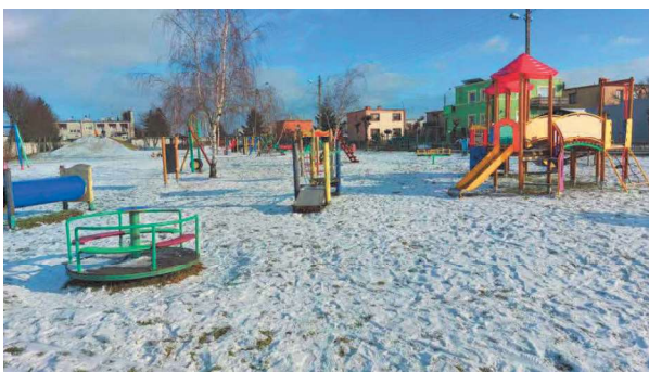
Plac zabaw przy ul. Dojazdowej