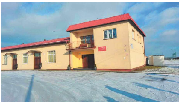
Świetlica wiejska w Święciechowie