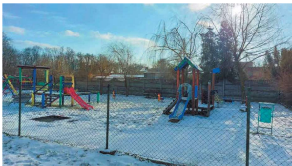
Plac zabaw przy ul. Lasocickiej