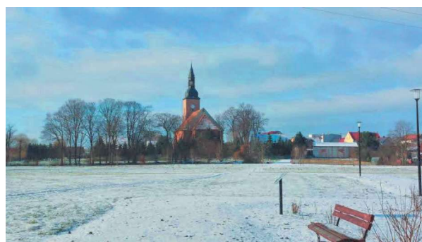
Teren nowego parku w Święciechowie