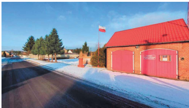
Remiza OSP w Długiem Nowe