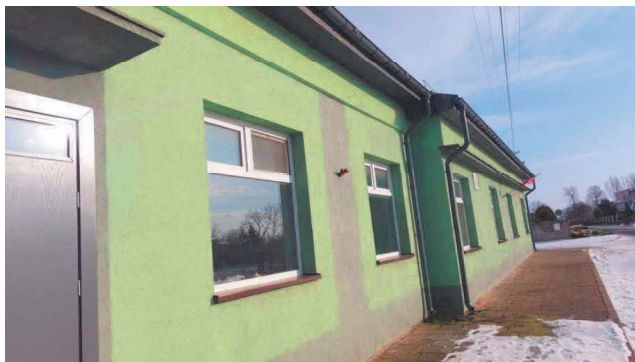
Sala wiejska w Długiem Nowe