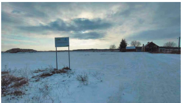
Tereny inwestycyjne (pod boisko wielofunkcyjne)