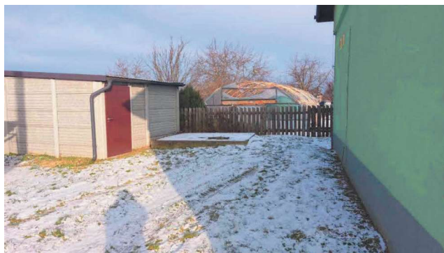
Teren wokół sali