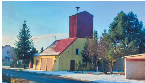
Remiza OSP Lasocice