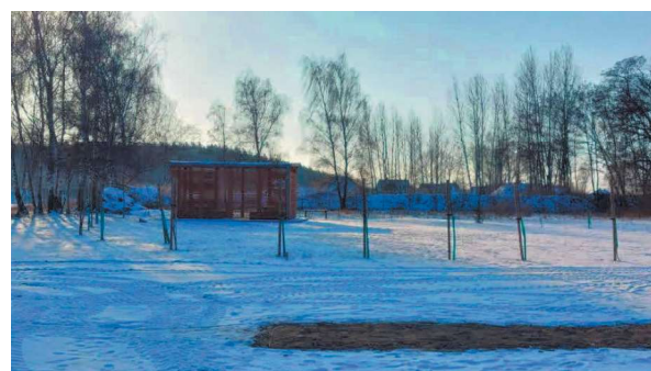
Lasostrefa- teren rekreacyjny na tzw. Niemcu