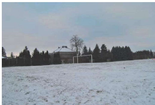
Kompleks rekreacyjno - sportowy