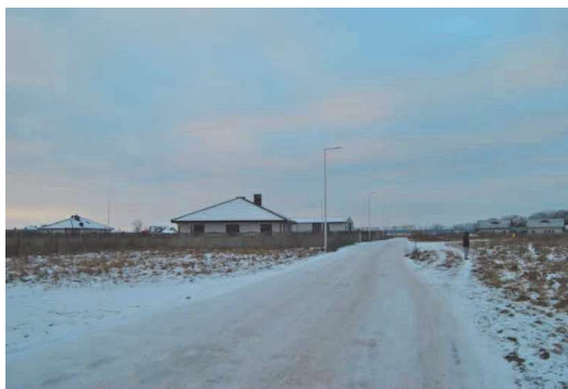
Ulica w nowej części wsi