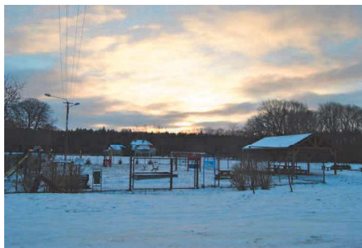
Plac zabaw, wiata i boisko w tle