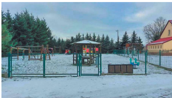
Plac zabaw w Niechlódzie